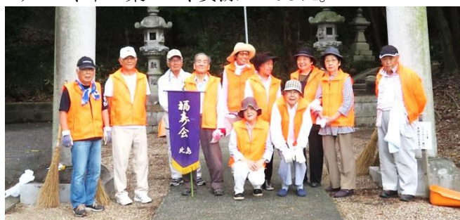
写真、高針学区福寿会(高牟神社、令和元年9月1日)

昨年度の活動概要は、16学区から報告され、参加クラブ43、延活動人員744、公園・校庭・神社の掃除、主要道路・側溝のゴミ拾い、植栽の剪定・除草作業で、収集したごみの量は、45リットル袋で一般ごみ120、木の葉282、資源71でした。