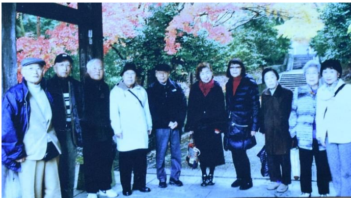
「明けない夜はない」クラブ員一同、注意は怠らず一日も早く、難敵退散の日を迎えたいと願っています。

易経の言葉「楽天知命故不憂」(楽天的な気持ちで、生死は天から与えられた寿命と達観すれば、心は晴れやか)、もう一つは荀子(じゅんし)の「美意延年」(心を明るく保てば、寿命を延ばす)、さらに「心静而長寿」(心を静かに保てば長生きできる)です。(写真下 曇興寺 2017.11.29)